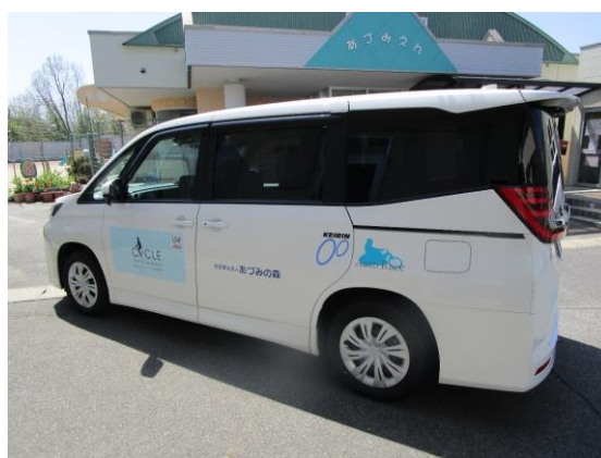
車両側面 (助手席側)