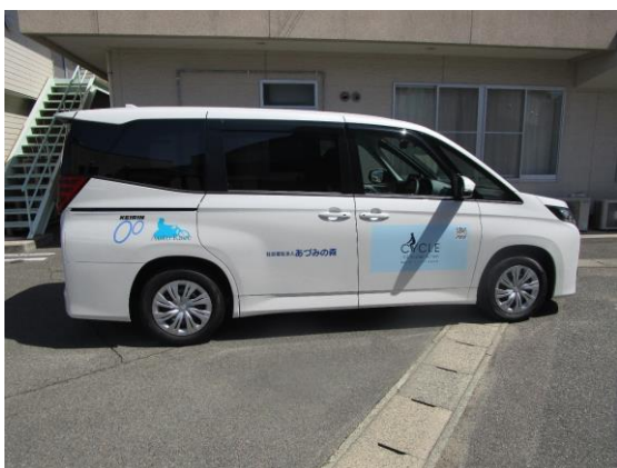
車両側面 (運転席側)

移送車4〈特別装備なし〉(URL) http://aduminomori.or.jp/archives/429